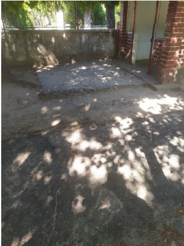
Kisház melletti burkolatfelújítás