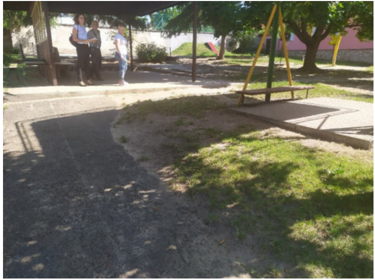
Meglévő aszfaltos járda felújítása