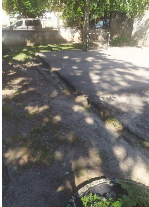
Aszfaltos focipálya szélének javítása